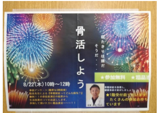
【看護師自作のポスター】