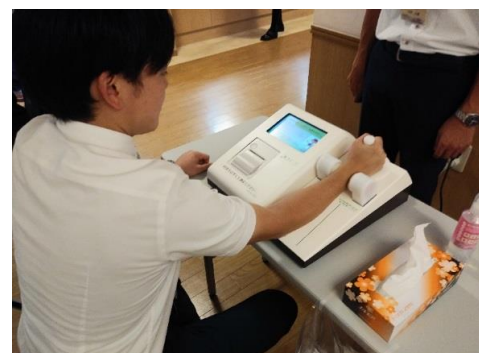
実際の骨密度測定の様子